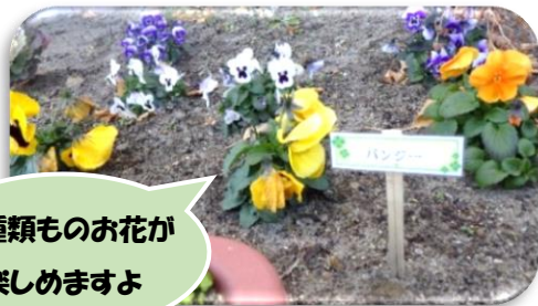
何種類ものお花が 楽しめますよ