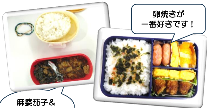
卵焼きが 一番好きです!

オルタ訓練生の昼食は何を食べているのか、今回はお弁当派の皆さんにうかがいました。ご紹介します♪