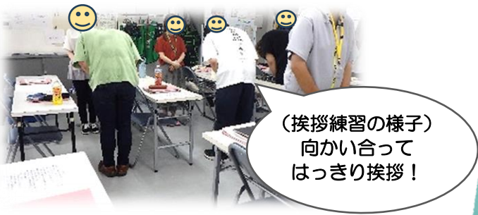
(挨拶練習の様子) 向かい合っ てはっきり挨拶!

朝礼では、挨拶練習や1分間スピーチ、ビジネスマナーを確認します。挨拶練習は、二人で向かい合って行い、職場を意識して取り組みます。1分間スピーチでは自分の考えを集団に伝えられるよう、好きな食べ物や季節の話題について話します。ビジネスマナーでは、職場での過ごし方や自立していく上で必要な事を確認します。私は、相手に聞こえる挨拶を意識しており、ビジネスマナーで学ぶことは普段の活動でも助言を受けるため気をつけています。