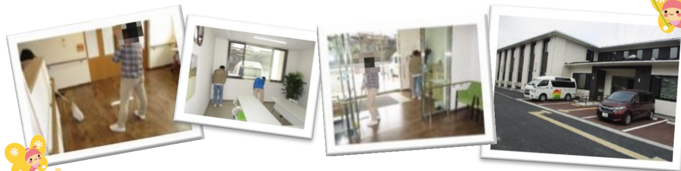
「抱優館南光台東」の作業訓練時の一日の流れ