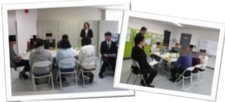
■3事業所の人事担当者様が来所くださいました