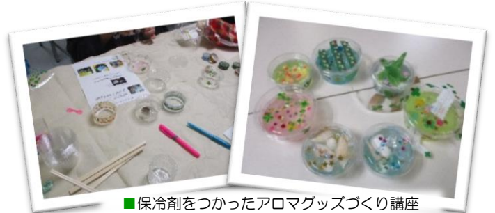
■保冷剤をつかったアロマグッズづくり講座