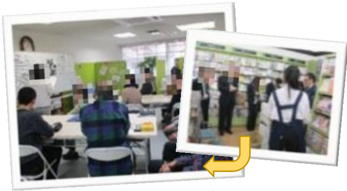
■企業見学講座のながれ