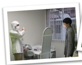
↑ 職場体験実習にむけて オルタで職員と身支度練習♪