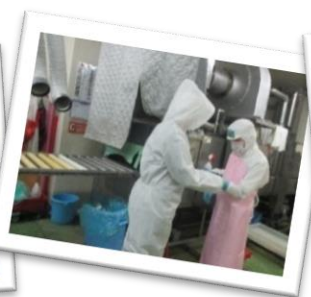
↑ 事前に練習できたので、初日でも準備がスムーズ(*~*) 実習中は、必要に応じて職員がサポートに入ります