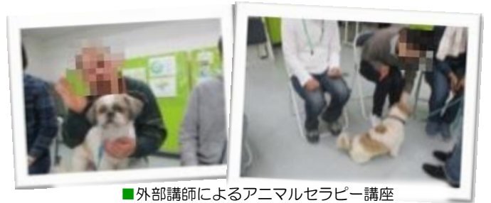
■外部講師によるアニマルセラピー講座

オルタ八乙女では、他の支援機関さんと連携した合同講座を行っています。一緒に活動しているのは精神科クリニックのテイケアさんや、フリースクールを利用している皆さんなど。 オルタの皆さんと一緒にヨガやストレッチ、アニマルセラピー、アロマ講座、スポーツ交流など…楽しく活動しています♪ みなさん、何度かお会いしていくうちに打ち解けて交流できるようになっているのも素敵ですね。