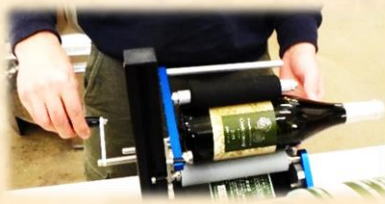
ワイナリー作業（ワインボトルのラベル貼り、ギフト用箱折り）：1時間 100円