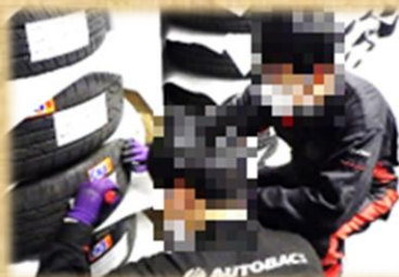
リストから商品を見つけ、印をつける