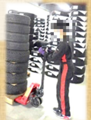
商品をパレットに積み、ハンドリフトで所定の位置に運ぶ