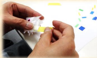
保育園作業：1時間 150円