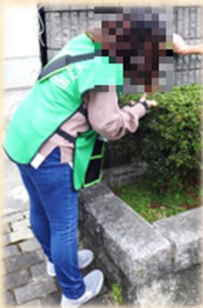
ポスティング：1回 300円