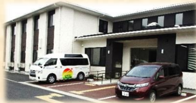
高齢者施設（環境整備）：1時間 300円