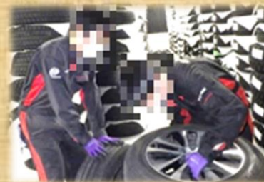
丁寧に商品を取り出す